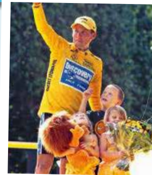
Lance Armstrong med sine barn på podiet i 2005.

Akkurat som for fugler i formasjon, er det lettere å sykle i feltet fordi luftmotstanden der er mindre. Der vil de som tevler om ulike trøyer, sykle bak oppofrende hjelperyttere for å spare krefter til angrep. Er de tørste, vil en hjelperytter hente vann. Går sykkelen i stykker, vil en hjelperytter tilby sin egen – og kan til og med sabotere andre (ulovlig) for å bane vei. Belønning? En andel av lederens premiepenger.